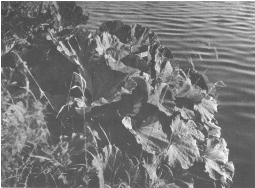
Bach- und Flußufer bedecken die riesigen Blätter unserer Pestwurz ( Petasites hybridus (L.) G., M., SCH.)