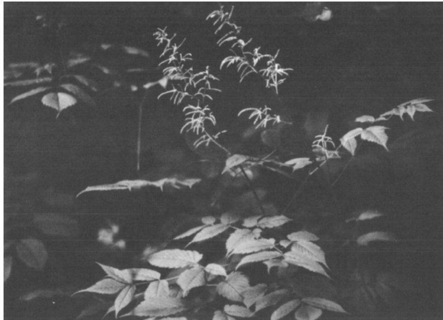
Der Waldgeißbart ( Anuncus dioicus (WALT.) FERNALD) wächst an den feuchten Rändern der östl. wie der westl. Illerleite. Die Pflanze muß dringend geschont werden!