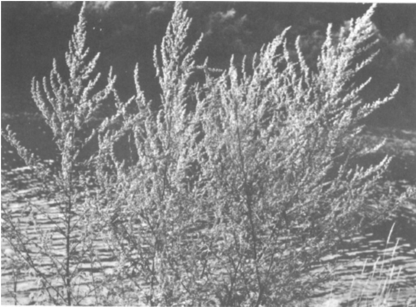
Der gemeine Beifuß ( Artemisia vulgaris L.) gehört zu den wenigen Kompositen, welche durch den Wind bestäubt werden.