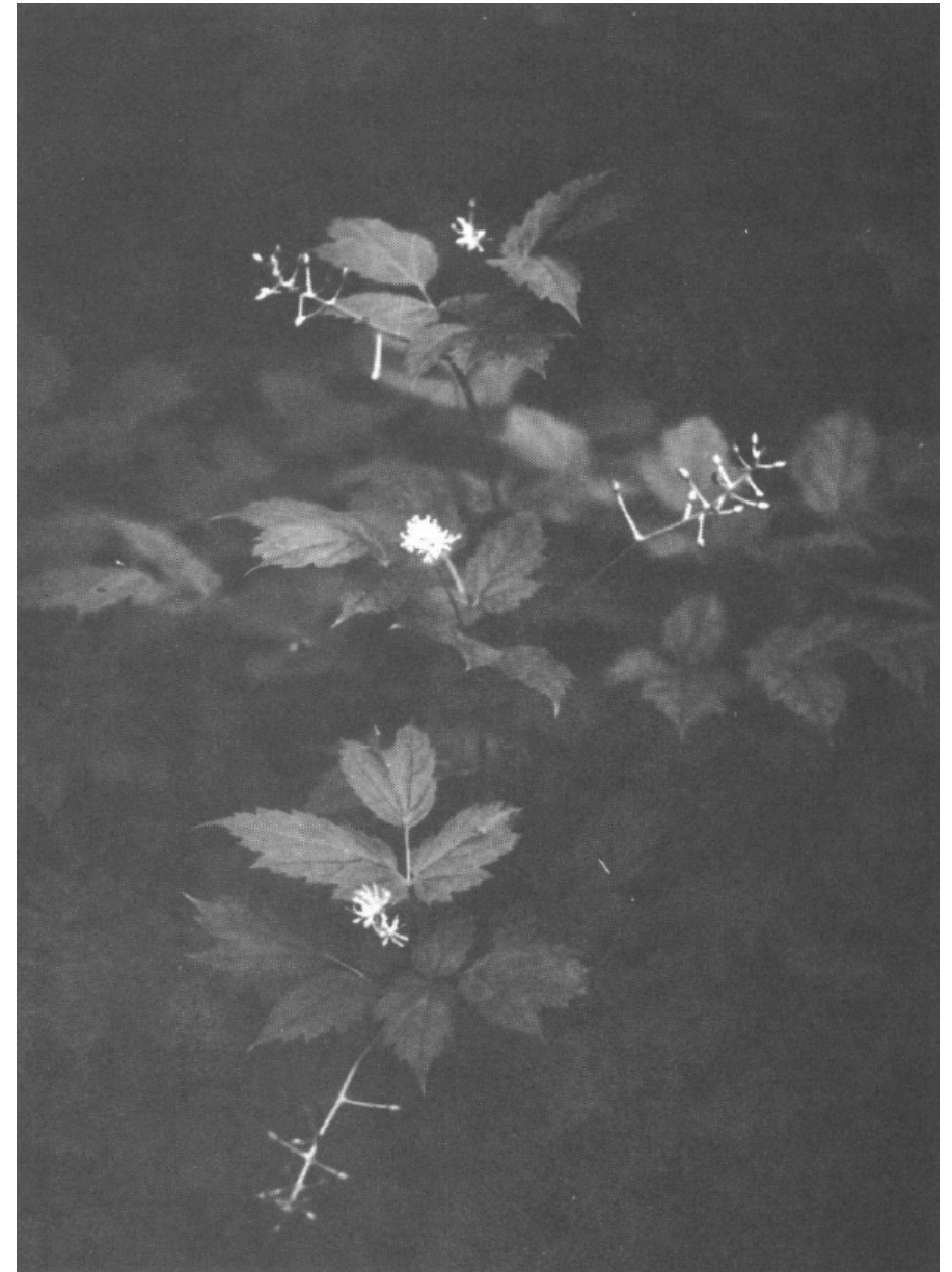
Das Christophskraut ( Actaea spicata L.) liebt feuchte, schluchtenreiche Bergwälder, An den feuchten Talhängen unserer Alb ist diese Pflanze häufig, an den Leitenrändern des westl. Illertales aber sehr selten anzutreffen.