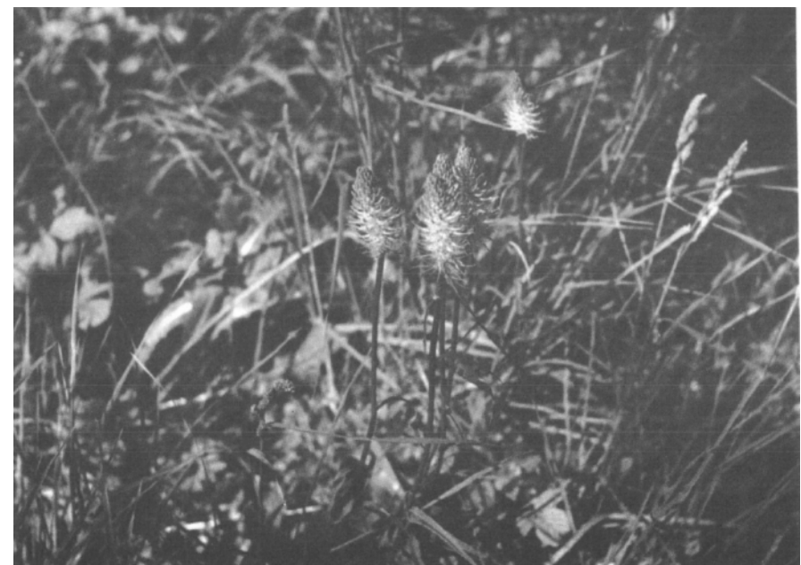
Die ährige Teufelskralle ( Phyteuma spicatum L.) liebt Standorte in krautreichen Laub-Mischwäldern.