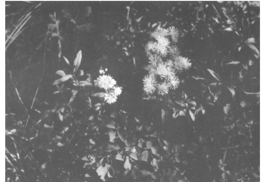
Nicht häufig, aber noch vorhanden, ist in unseren Auen die Wiesenraute ( Thalictrum aquilegifolium !)