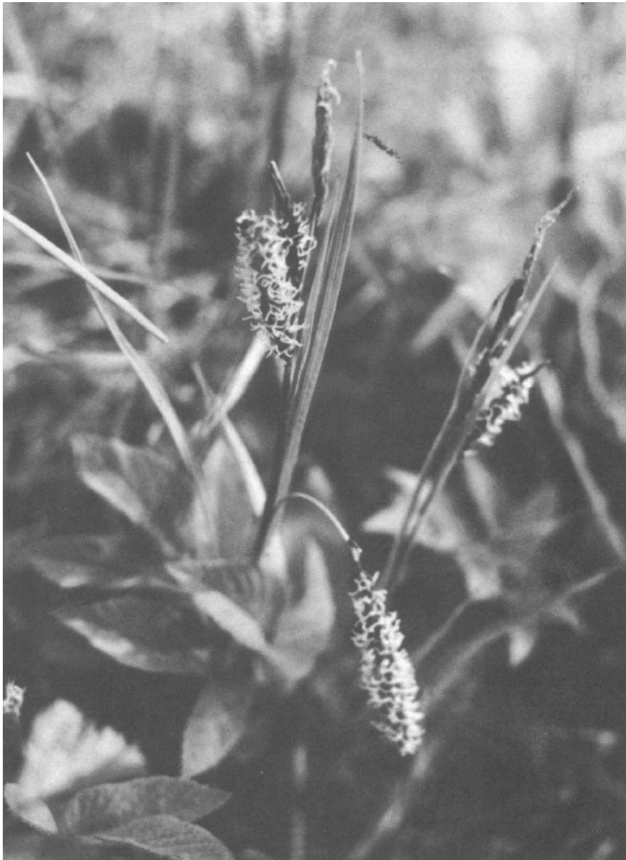
Die blaugrüne (schlaffe) Segge ( Carex flacca SCHREB.) gedeiht gut auf Standorten mit wechselnder Wasserführung