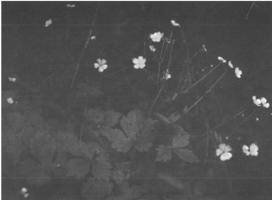
Auf feuchten, nährstoffreichen Standorten wächst in Laub-Mischwäldern der wollige Hahnenfuß ( Ranunculus lanuginosus L.)