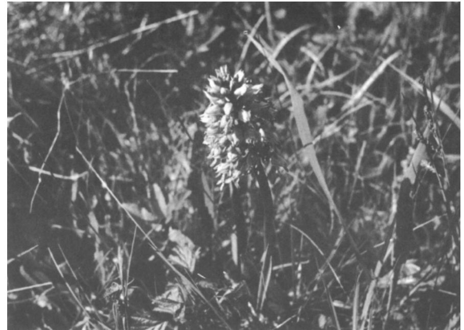
Das Halmnabenkraut ( Orchis militaris L.) ist eine der wenigen Orchideen, die wir in unseren Auen noch vorfinden.