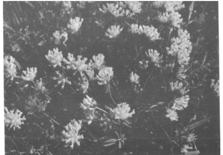
Hin und wieder trifft man in den Auen auf ein Prachtexemplar des Wundklees ( Anthyllis vulneraria L.)