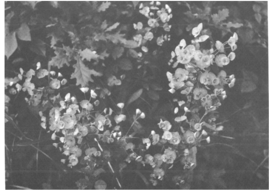
Die Mandelwolfsmilch gedeiht auch südl. der Donau auf wärmeren Tal- und Riedelstandorten, ist aber wesentlich seltener anzutreffen als auf der