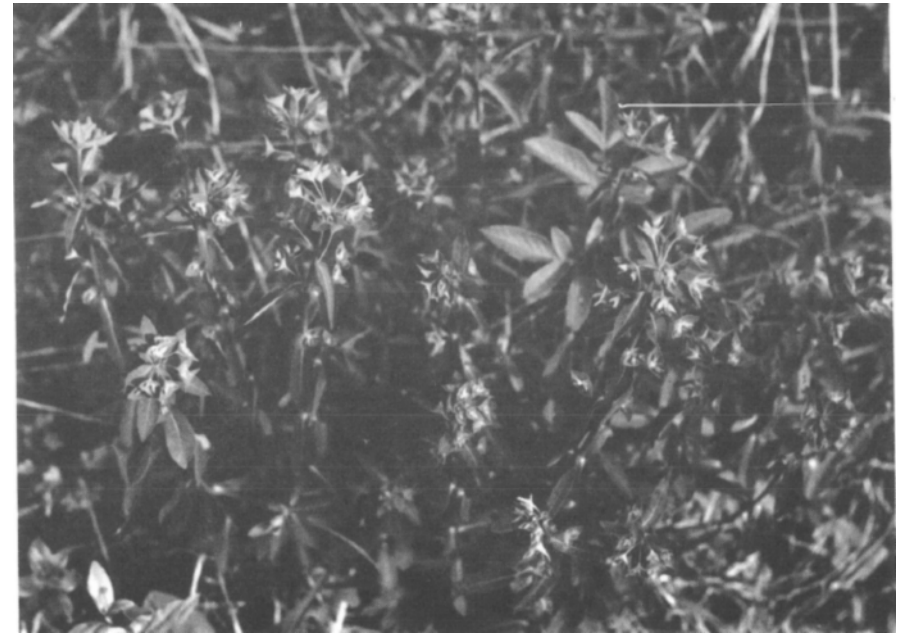
In unseren Flußauen ist an etwas wärmeren Standorten die süße Wolfsmilch ( Euphorbia dulcis ssp. purpurata ) anzutreffen.