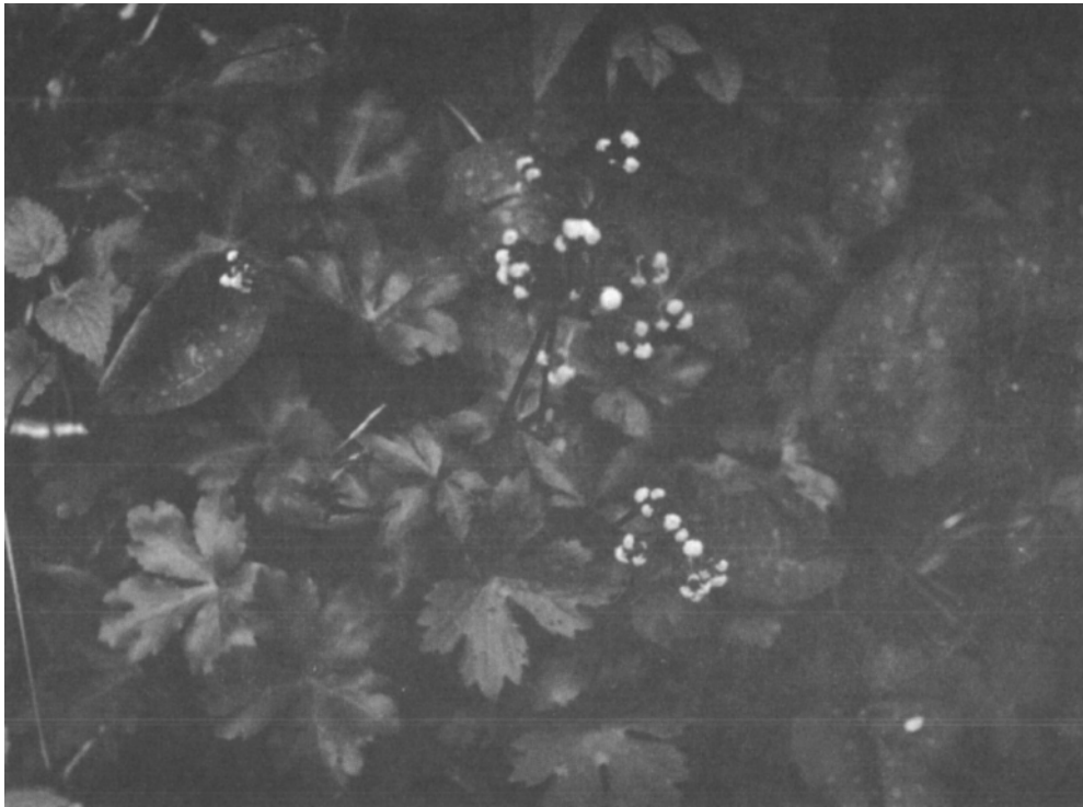
Sanikel(Saniewla eüorpaea L.) Ein Relikt aus der Tertiärzeit ist in unserer Flora der Sanikel

Schema der Naturräuml. Gliederung I-IV entsprechende Zonen im Jllertal und auf den Leiten (abgeänderte Kartengrundlage n dem Raumordnungsbericht der Region Donau - Jller - Blau ) O = östliche Leite W = westliche Leite