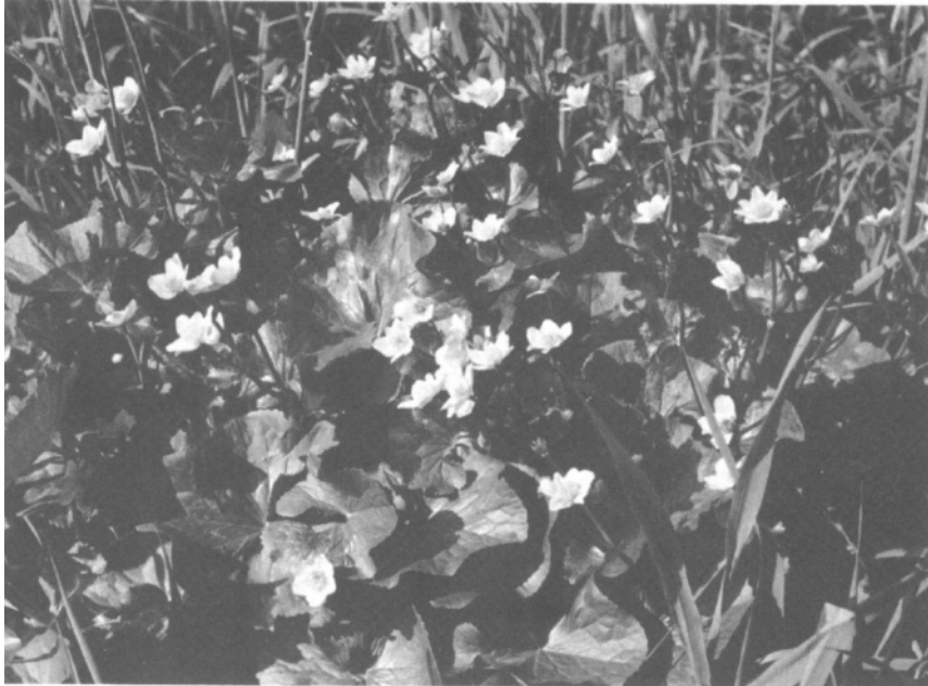
An feuchten, quelligen Stellen wächst bevorzugt die Sumpfdotterblume ( Caltha palustris L.)